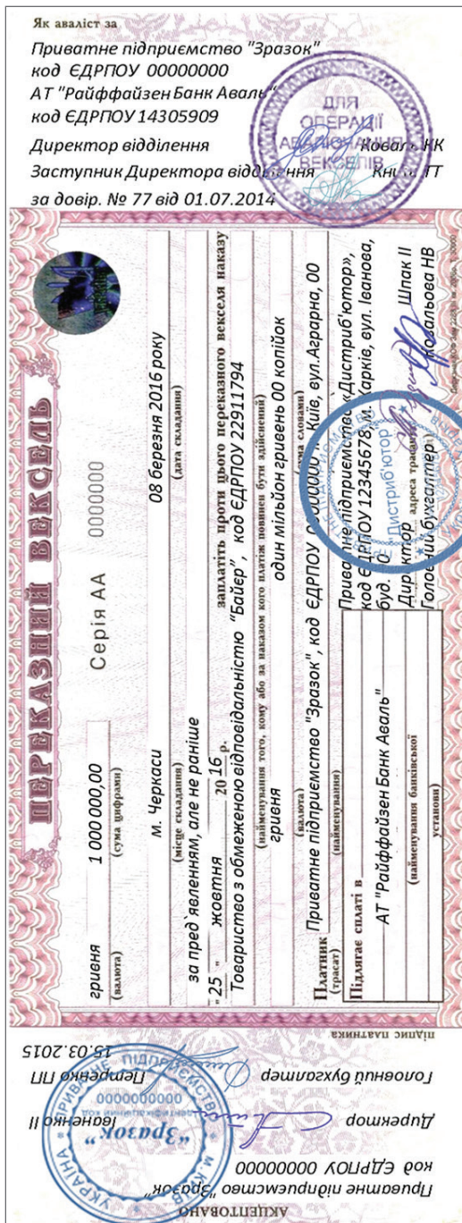
Схема вексельного розрахунку — переказний вексель (тратта)