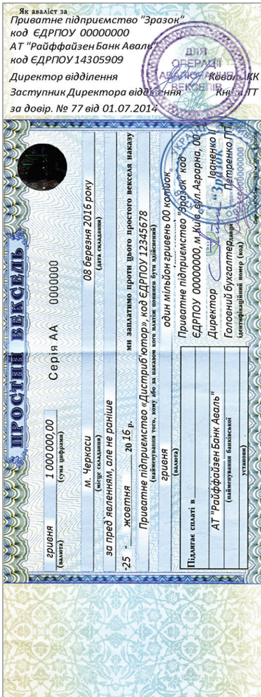
Схема вексельного розрахунку — простий вексель